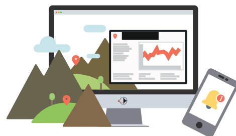
Ricevi i tuoi dati